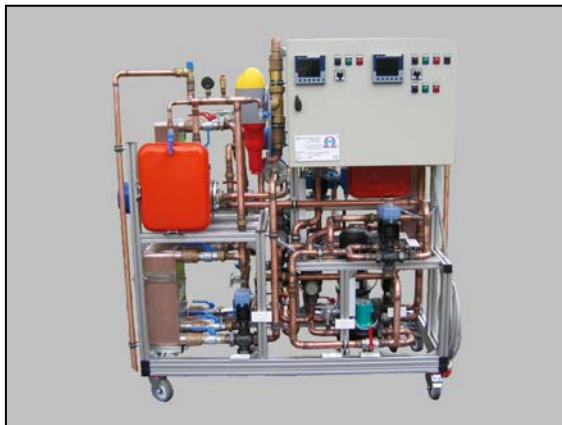
VeLW für Sole- Wasser- Wärmepumpe (4 – 32 kW)