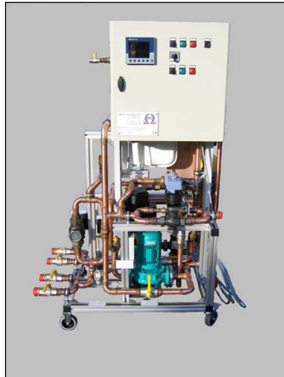
VeLW für Gaswandgerät (13 – 110 kW)

Die kompakte Bauweise und die Möglichkeit der Abstimmung der Einheiten auf jedes einzelne Gerät runden die Vielseitigkeit der VeLW ab.